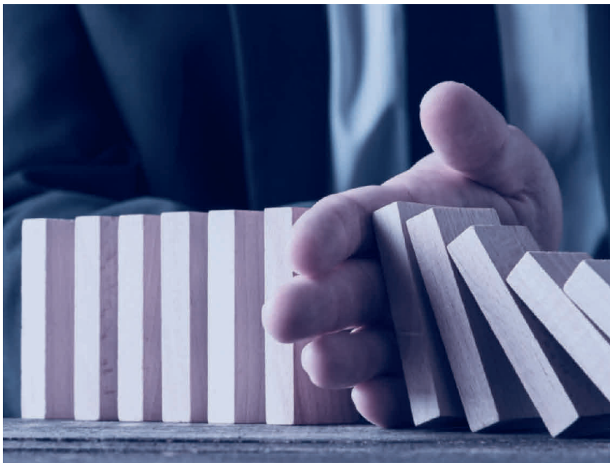
Wer seine Risiken kennt, kann sich vorbereiten und deren Auswirkungen mindern.

Die Probleme einer Krise verschwinden nicht immer von alleine – denn unerschwinglich sind sie manchmal schon vorher vorhanden und werden durch die Krise verstärkt. Deshalb sollten Unternehmen handeln, bevor aus einer Strategiekrisis eine Ertragskrise und anschliessend eine Liquiditätskrise wird, die im schlimmsten Fall zur Insolvenz führt. Einer der Erfolgsfaktoren für einen erfolgreichen Wandel lautet: Je früher Veränderungen angegangen werden, umso erfolgreicher sind sie. Sich frühzeitig mit geänderten Rahmenbedingungen und Marktgegebenheiten auseinanderzusetzen, packt das Problem an der Wurzel. Es lohnt sich ausserdem, sich laufend kritisch mit internen Strukturen und Prozessen zu beschäftigen, sie zu optimieren und damit Kosten zu senken. Damit wird Ihr Unternehmen auch für schwierige Zeiten gerüstet sein.