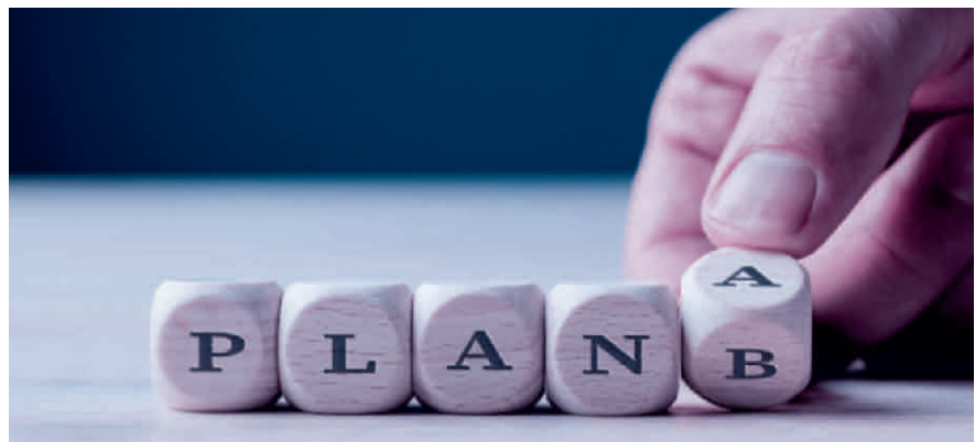
Schafft eine Strategieveränderung neue Chancen, um die Firma zu retten?

Durch eine Nachlassstundung erhält ein Unternehmen für einen bestimmten Zeitraum Schutz vor seinen Gläubigern, sodass es in der Lage ist, Sanierungsmöglichkeiten zu prüfen und umzusetzen. Beim zuständigen Gericht wird hierfür ein Antrag auf Gewährung der Nachlassstundung gestellt, die bei nicht gelungener Sanierung in einem Nachlassvertrag mündet. Während der Coronazeit