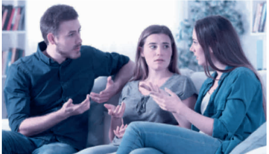
Kommt es zum Streit zwischen den Erben, muss der Willensvollstrecker schlichten.

Der Willensvollstrecker setzt den letzten Willen des Erblassers um. Dafür stellt er als Erstes ein Inventar auf, das er laufend nachführt. Er verwaltet die Erbschaft bis zur Teilung und muss darauf achten, dass das Vermögen erhalten bleibt. Er bezahlt die Schulden des Erblassers inklusive der Todesfallkosten und treibt offene Forderungen ein. Zur Verwaltung gehören auch die laufenden Geschäfte, beispielsweise muss er sich um den Unterhalt von Liegenschaften kümmern, laufende Verträge kündigen oder allenfalls die Liquidation einer Einzelunternehmung umsetzen. Er ist verantwortlich für die Erstellung der